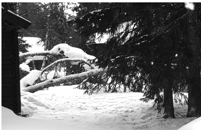
Så här ser det ut på många ställen. Det finns gott om ved.

Man tittar i almanackan och helt plötsligt är det snart påsk. Skärtorsdagen infaller den 6 april. Det är i och för sig bra med en tidig påsk. Det är inte speciellt mycket snö, men det räcker gott och väl till att åka skidor och skoter. Runt jul kom det mycket blötsnö, vilket gjorde att mängder av björk antingen bröts av eller har böjt sig så att kronorna har frusit fast i marken. Det är många av oss som har mycket jobb med motorsågen framöver. Några frivilliga har huggit upp vägarna fram till våra stugor, vilket styrelsen tackar för. Länsstyrelsen har också röjt skoterlederna så att det är lättframkomligt för den som vill fiska. Skidspåren är också röjda, preparerade och fina. En annan fördel med en tidig påsk är att det går att åka skoter på statens mark hela veckan efter påsk. Skoterförbudet brukar vara runt den 20 april.