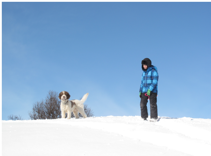
Kompisar i snön