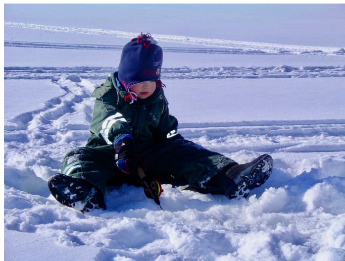
Var är fisken?

Den gångbro som byggdes under arbetshelgen, har gjort att promenaden runt sjön blivit både lättare och torrare.