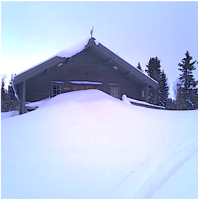
Kapellet den 10 februari.

Äntligen har vi en normal vinter. Dom tre föregående räknar jag som onormala. I år har vi haft en vinter med minusgrader och så har det kommit en hel del snö. Inget rekord, men runt en meter har det kommit. Det som varit lite speciellt i år är att det har blåst en hel del, så snötäcket har blivit lite ojämnt fördelat. Vi har haft mycket ostliga och sydostliga vindar. Det syns tydligt på takens "läsidor" där det har samlats väldigt mycket snö. Självt jag upp och skottade vår stuga helgen den 10 februari och då var det på sina ställen en meter packad drivsnö på taket. Man fick skära lagom stora block med spaden för att orka.