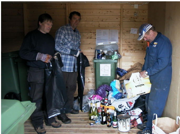
Här ses de tre stugägarna som städat efter er andra

Ett av dom viktigaste arbetena under lördagen var att städa sopboden. Kommunen hade ställt krav på att allt som inte får slängas i boden och som lämnas kvar av sophämtarna skulle bort. Det var några av föreningens medlemmar som fick till uppgift att städa efter er andra som inte respekterar de anslag som finns uppsatta. Det blev en full släpvagn som jag tog med och tömde på olika återvinningsstationer.