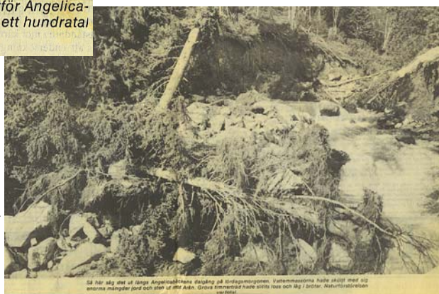
Så här såg det ut längs Angelicabäckens dalgång på lördagsmorgonen. Vattenmassorna hade sköljt med sig enorma mängder jord och sten ut mot Arån. Grova timmerträd hade slitits loss och låg i brötar. Naturförstörelsen var total.

”Så här såg det ut längs Angelicabäckens dalgång på lördagsmorgonen. Vattenmassorna hade sköljt med sig enorma mängder jord och sten ut mot Arån. Grova timmerträd hade slitits loss och låg i brötar. Naturförstörelsen var total.”