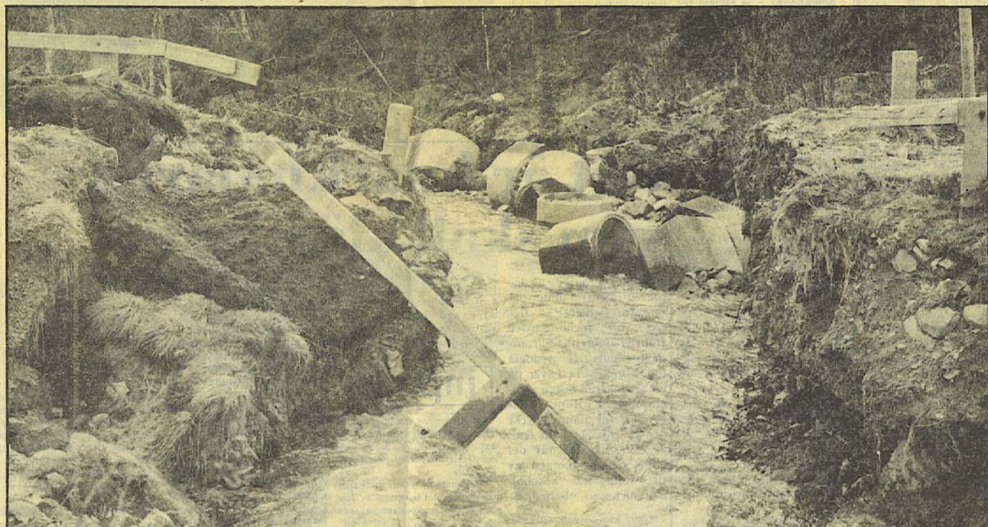
Det var inte mycket som återstod av brobanken sedan vattenmassorna vräkt sig utför Angelicabäcken. De stora betongtrummorna låg utspridda långt nedanför bron. Ytterligare ett hundratal meter längre ned låg resterna av träbron över dammen.