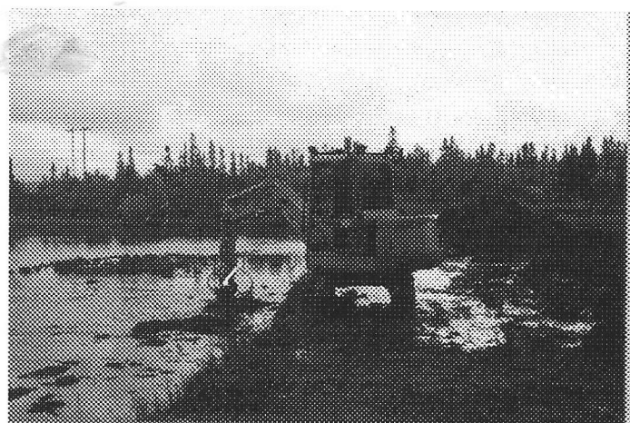
Abbe jobbar vid dammen

Lördagen avslutas med sedvanlig surströmmingsfest med dans till levande musik. Ta med gott humör.